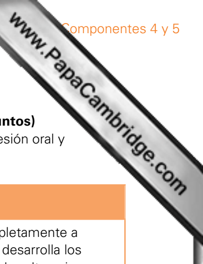
Tabla B: descripciones de las bandas para el Componente 5, Parte 2: debate (20 puntos)

En la Parte 2 deberán otorgarse puntuaciones independientes para cada categoría (expresión oral y comprensión oral).